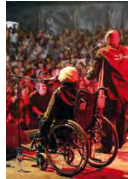
System mit Pfandbechern und rollstuhlgängige Bühnen am Paléo Festival in Nyon.