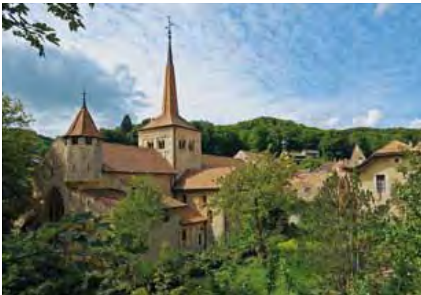
Die Abbatiale in Romainmôtier liegt an der ViaFrancigena.

zum Leitgedanken; entsprechendes Lern- und Informationsmaterial wird bereitgestellt. Die Entdeckungswanderungen tragen zudem zur physischen und psychischen Gesundheitsförderung bei. Nicht zuletzt ist die – durch den Europarat ausgezeichnete – ViaFrancigena ein Symbol für die europäische Zusammengehörigkeit.