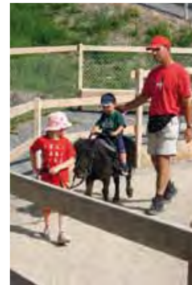
Das Reka-Feriendorf Urnäsch hat sich gut in die Gemeinde und in die Landwirtschaft integriert.