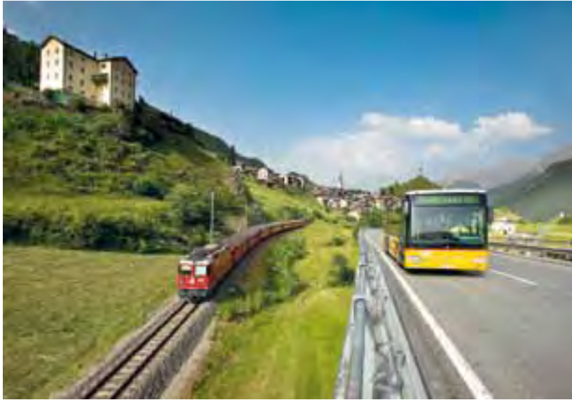
Der öffentliche Verkehr spielt im Unterengadin eine wichtige Rolle.

hin zur zeitgenössischen Kunst. Auch Gesundheit wird gross geschrieben: Die Angebote reichen von Thermalbädern mit Plausch- und Therapiemöglichkeiten über weitläufige Fusswege bis zu Radrouten und Langlaufpisten. Auch spezielle Kinder- und Seniorenangebote sind vorhanden.