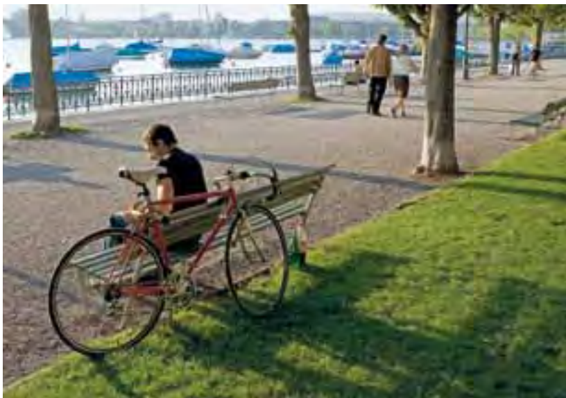
Zürich Tourismus setzt in Zusammenarbeit mit Stadt und Region auf den Langsamverkehr.

internationale Hilfsprojekte wie die Wanderausstellung «Wasser für alle!» von Helvetas. Mit dem Verkauf der Trinkwasserflasche ZH2O unterstützt Zürich Tourismus das Wasser-Hilfsprojekt PlayPumps in Tansania.