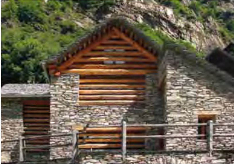
Renovation traditioneller Gebäude für den Agrotourismus in Brontallo.

verarbeitet und die Produkte möglichst lokal verkauft. Mit dem ländlichen Tourismus wurden in Brontallo ein weiteres wirtschaftliches Standbein und einige zusätzliche Arbeitsplätze geschaffen.