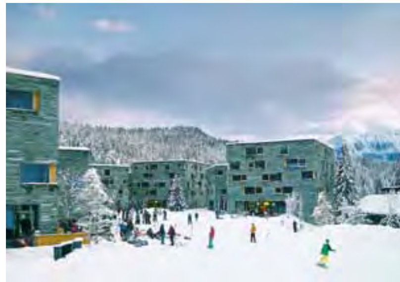
Das «rockresort» in Laax stellt eine gute Alternative zu den kalten Betten dar.

Im Werkzeugkasten, der vom Kanton ausgearbeitet wurde und der die Anwendung dieser Bestimmungen erleichtern soll, sind Begriffe definiert, Vorgehensweisen für Gemeinden und Planungsfachleute skizziert sowie rund ein Dutzend Einzelmassnahmen beschrieben, beispielsweise aktive Baulandpolitik, Kontingentierung, Erstwohnanteil, Lenkungsabgaben oder die Zweitwohnungssteuer.