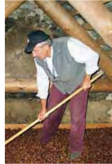
Gràa zum Trocknen der Kastanien und Dorfladen mit Produkten aus dem Tal.

Dank der Teilkonzepte blieben schon fast aufgegebene Kastanienwälder erhalten, die Fledermäusen, Vögeln und Insekten einen Lebensraum bieten.