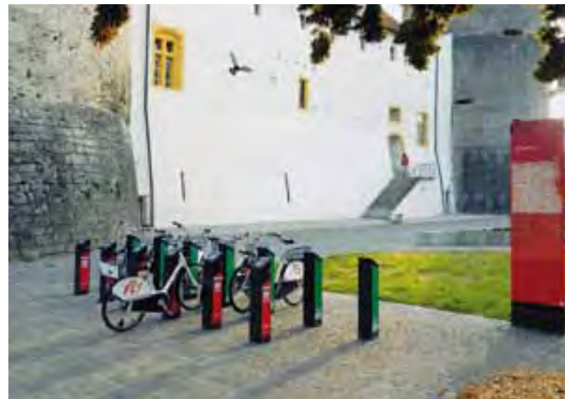
Mit dem Velo des Ausleihsystems die Region Yverdon-les-Bains entdecken.

ist daher leicht mit den öffentlichen Verkehrsmitteln zu erreichen. Dem Langsamverkehr wird ein hoher Stellenwert eingeräumt: Ausflüge zu Fuss, insbesondere auf den drei historischen Verkehrswegen Via Romana, Via Francigena und Via Salina bilden attraktive Angebote. Auch die Nutzung des Fahrrads wird gefördert, z.B. mit dem Veloverleih in Yverdon-les-Bains, dem Velopass, den E-Bike-Vermietungen in Ste-Croix, Yvonand und Orbe, dem Gratistransport der Velos auf der Zugstrecke Yverdon-les-Bains bis Ste-Croix und auf den Schiffen der Schifffahrtsgesellschaft des Neuenburger- und Murtensees. Ausserdem können Exkursionen auf Schiffen mit Elektrosolarantrieb unternommen werden. Alle Mitarbeiterinnen und Mitarbeiter erhalten kostenlos ein Halbtax-Abonnement. Neben dem Tourismusbüro in Yverdon-les-Bains befindet sich ein Mobility-Carsharing-Stellplatz. In Zusammenarbeit mit der Hochschule für Technik und Wirtschaft Waadt (HEIG-VD) werden Pionierprojekte wie Planet Solar, die erste Weltumrundung mit einem Solarboot, oder Icare, eine Weltumrundung in einem mit Wind- und Sonnenenergie betriebenen Fahrzeug, gefördert.