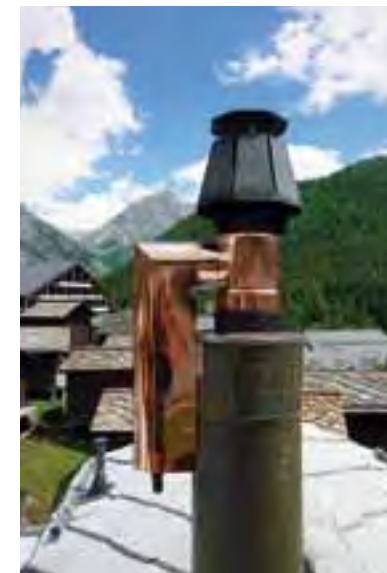
Brücke über den Almagellerbach und Wasserfassung der Suone Moosgufer. Feinstaubfilter in Saas Fee.

Unter den Projekten zur Förderung der erneuerbaren Energien gehört die Trinkwasser-Turbinierung zur Stromerzeugung zu den herausragenden Beispielen. Zudem hat Saas-Fee den Feinstaubfiltern den Kampf angesagt: In 70 Prozent der privaten und öffentlichen Holzheizungen wurden dank der finanziellen Unterstützung von Gemeinde und Unternehmen Feinstaubfilter installiert. Der Einbau der Filter führt vor allem im Winterhalbjahr zu einer deutlichen Verbesserung der Luftqualität. Damit ist der Ort auf dem besten Weg, eine feinstaubfreie Tourismusdestination zu werden. Mit dieser Aktion erhält auch die heimische Wirtschaft wichtige Impulse, geht doch ein Drittel der Investitionen für die Feinstaubfilter von rund einer Million Franken in Form von Aufträgen an lokale Unternehmen.