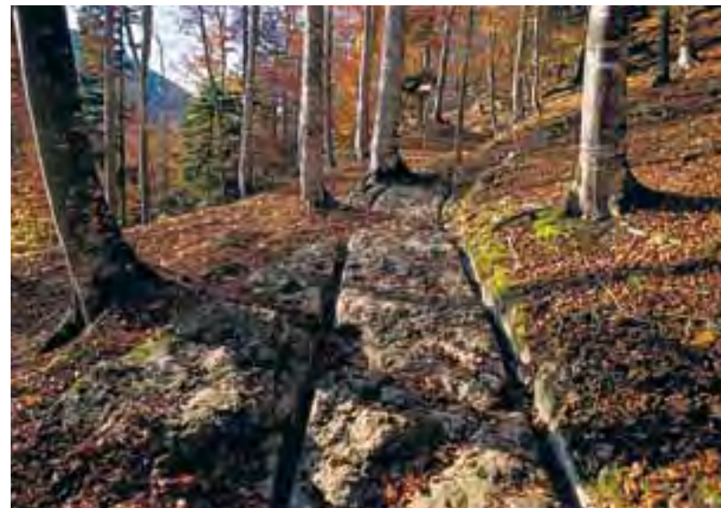
Historische Karrgeleise bei Sainte-Croix.

Die ViaFrancigena gehört als Teil der Kulturwege Schweiz zum Tourismusprogramm von ViaStoria, einem Spin-off-Betrieb der Universität Bern. Im Auftrag des Bundes erarbeitete die Organisation in den Jahren 1984 bis