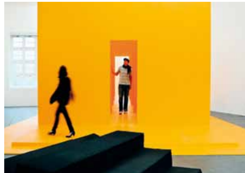
Kostengünstiger öV und Eintritt in Zürcher Museen dank der ZürichCARD.