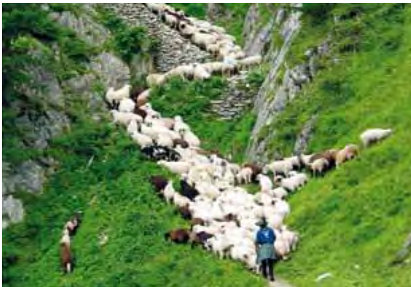
Die Pflege der traditionellen Schäferei ist Teil der nachhaltigen Regionalentwicklung.

Klimawandel sowie die Bewahrung der Welterberegion unter Einbezug einer nachhaltigen Regionalentwicklung.